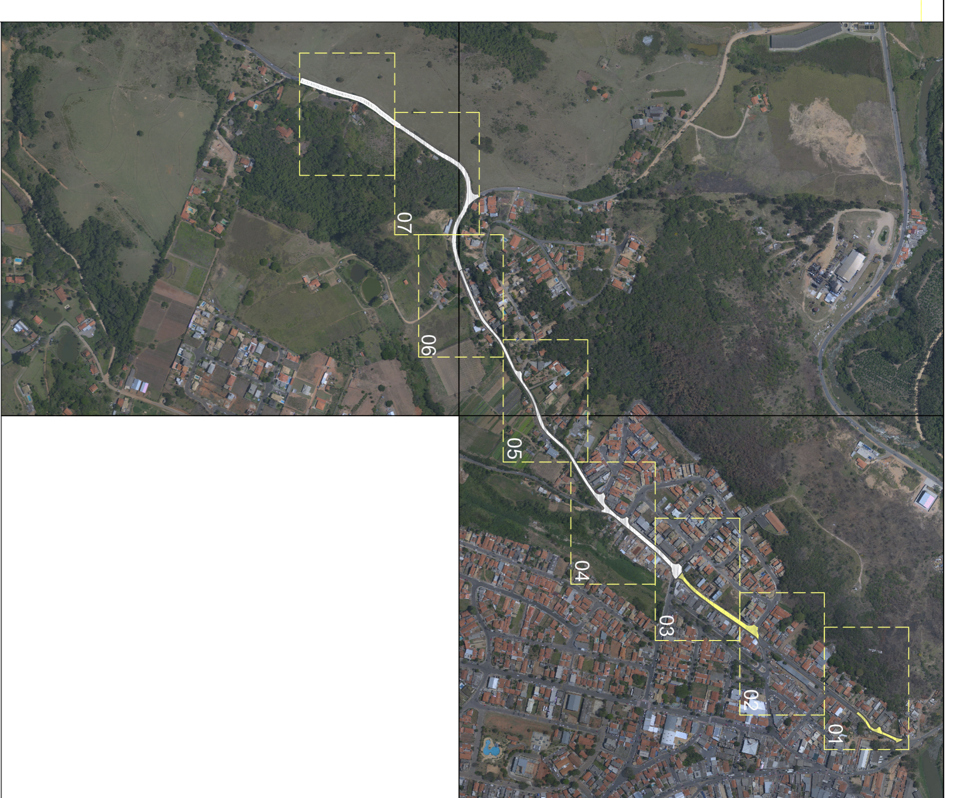
Detalhe - Recapeamento